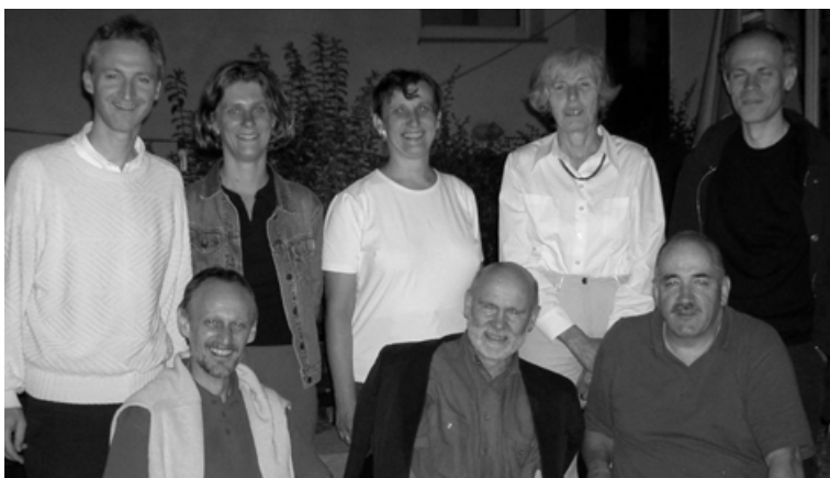
Bild links: Der Vorstand und die Rechnungsprüfer der Initiative FahrRad OÖ

Gleich in drei Gemeinden war die Initiative FahrRad heuer bei Veranstaltungen zum Autofreien Tag engagiert; nämlich – wie bereits in den letzten Jahren – in Linz und diesmal neu in Leonding sowie in Gallneukirchen.